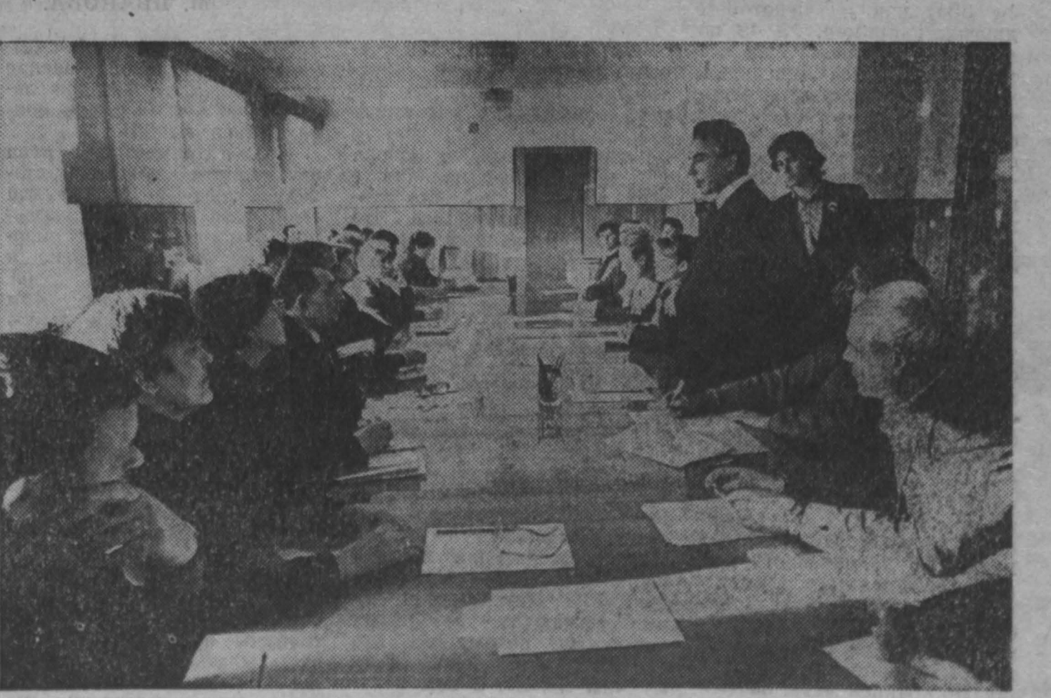
Множество злободневных вопросов было затронут в беседе за круглым столом, состоявшейся в облсовпрофе с представителями групп и комиссий рабочего контроля. Но особенно часто назывались две проблемы: низкое качество продукции, поступающей с перерабатывающих предприятий и неудовлетворительная работа автотранспорта, обслуживающего торговые предприятия. «Без решения этих проблем», считают контролеры, — никогда не добьются высокого уровня обслуживания ни в торговле, ни в общепите. Поэтому рабочая группа облсовпрофа взяла на себя задачу тщательно разобраться в ситуации и разработать ряд конкретных предложений.

В профсоюзах продолжается совершенствование структуры. ЦК профсоюза рабочих машиностроения и приборостроения принял решение о переходе в основном на двухзвенную структуру: профком — ЦК. В связи с этим упразднены обкомы. На профобслуживающих которых было менее 30 тысяч человек профсоюз, в том числе и Кемеровский обком профсоюза рабочих машиностроения и приборостроения.