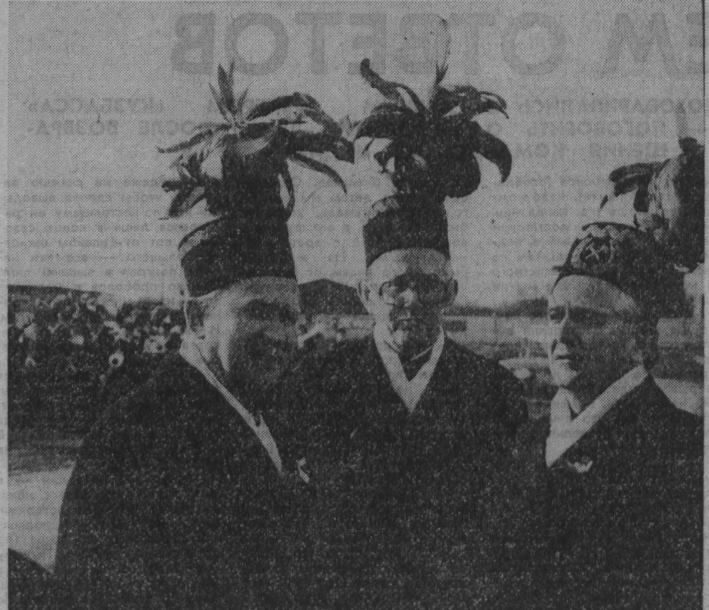
Польские шахтеры в народных костюмах.

Сотрудничают и научно-исследовательские институты горной промышленности. Польский главный горный институт установил плодотворные связи с Институтом имени Скочинского и научными учреждениями Сибирского отделения Академии наук СССР. Шахтеры Катовицкого воеводства многие годы поддерживают оживленные контакты