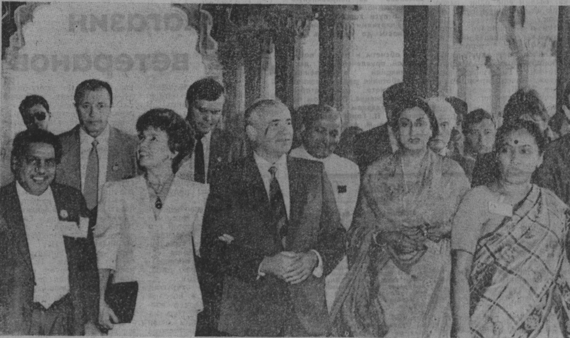
Во время посещения Красного форта.

Как апофеоз темы Октября на экране — изображение открытого в дни фестиваля в Дели памятника В. И. Ленину. «Идеал, которому посвятили себя такие титаны духа, как Ленин, не может быть бесплодным», — звучат слова Махатмы Ганди.