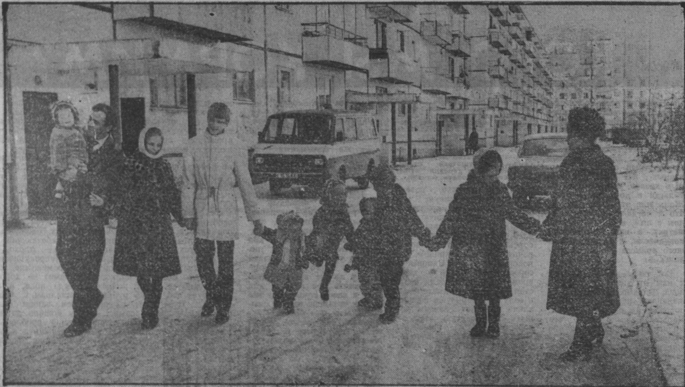
(Окончание. Начало на 1-й стр.)