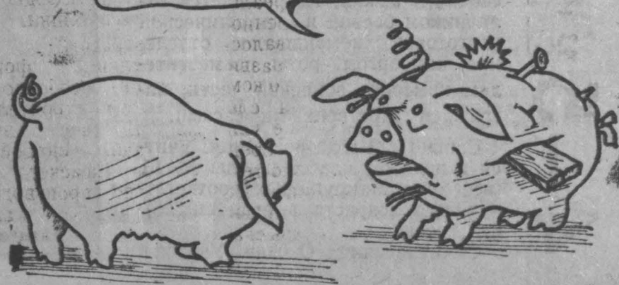
Рис. М. Ларичева.