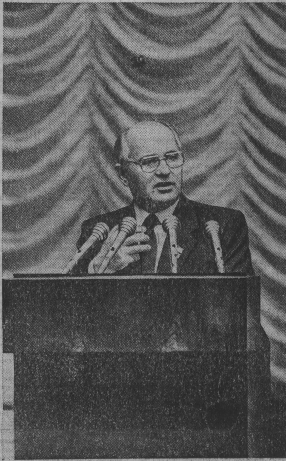
Во время встречи с молодежью столицы.

Голос. Мы предлагаем формировать вокруг памятника современную ему историческую среду. Есть специалисты, молодые люди, которые поедут и будут делать все, от реставрационных работ до возрождения прежних ремесел. Памятник должен жить, правда? Наша ассоциация трудовой инициативы как раз и дает возможность лю-