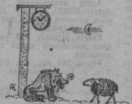
Рис. А. Климана.