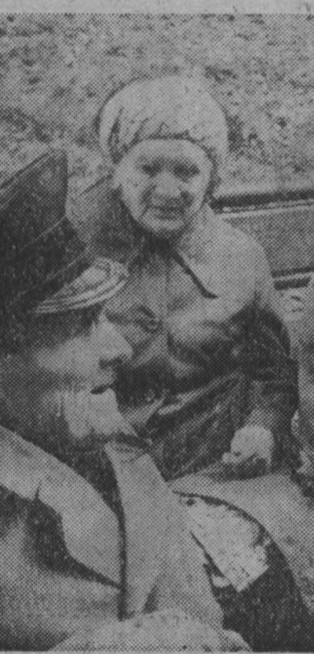
люди среди людей

Есть и другие пути к такой аппаратуре — через крупные промышленные предприятия, имеющие валюту. Прекрасно оснастили таким образом Иркутский кардиохирургический центр. Авансом получили в подарок от шахтеров 700 тысяч валютных рублей. До недавнего времени только начинающий свою деятельность.