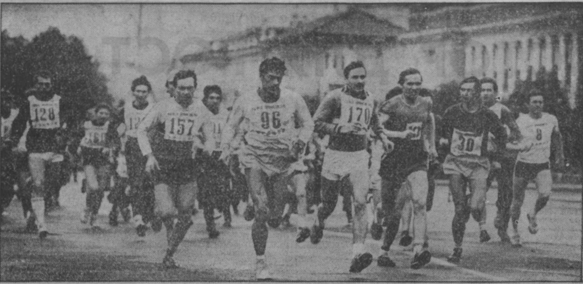
в честь праздника