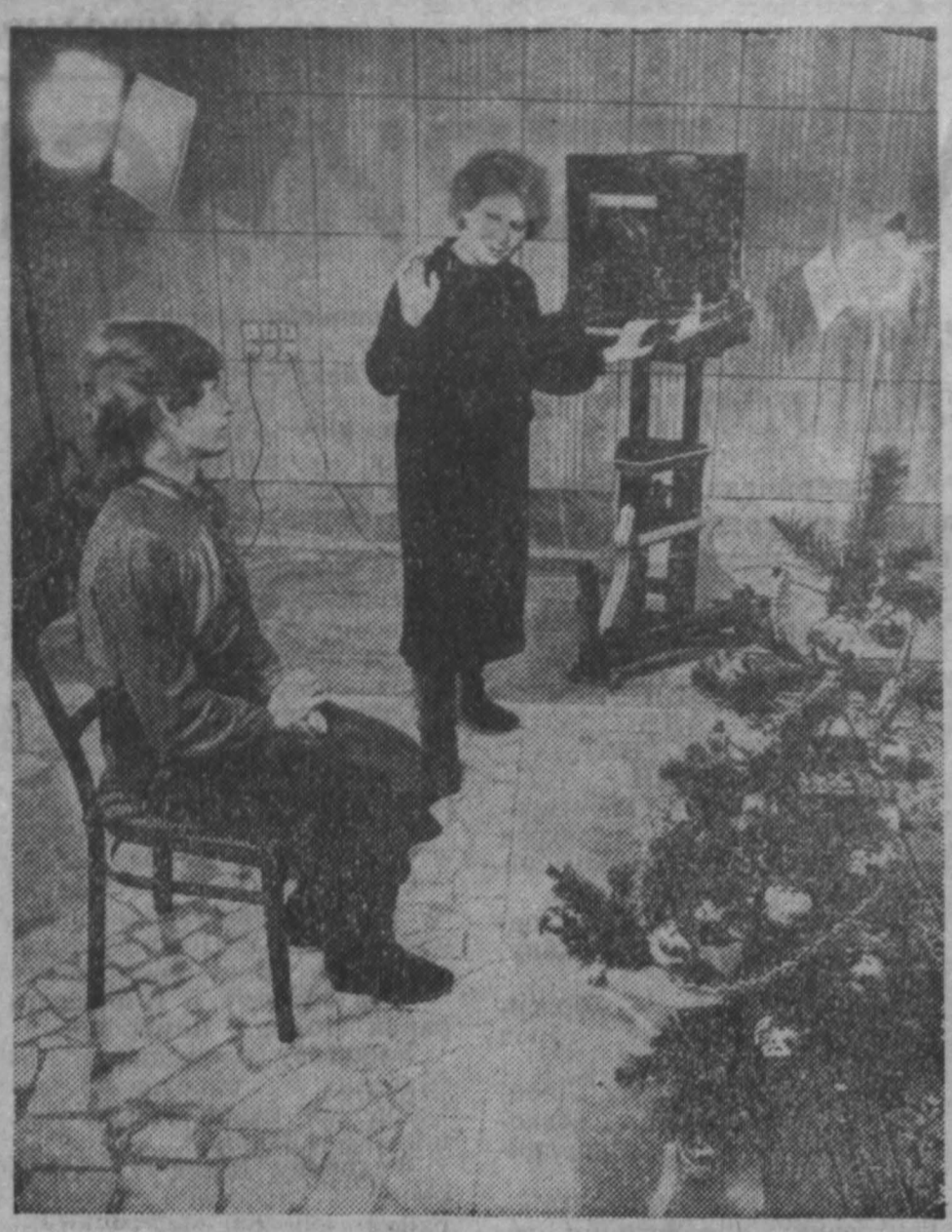
г. Кемерово.

НА СНИМКАХ: новая фотография; работает фотомастер Т. В. Логнинова.