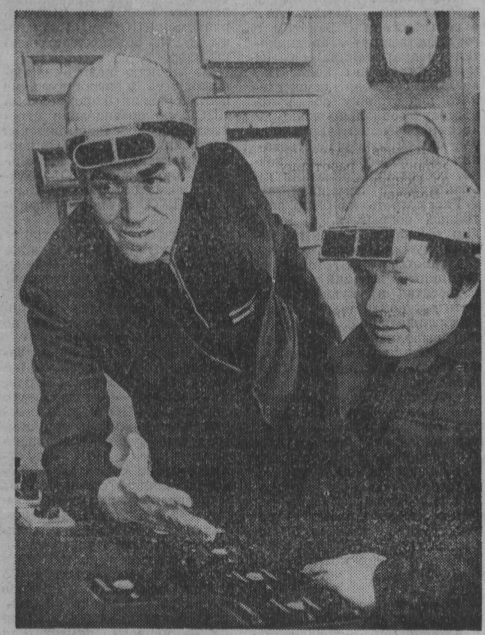
письмо в номер