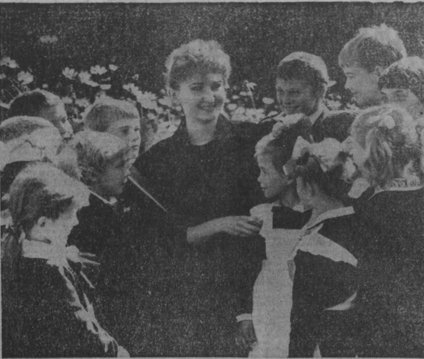
В Новокузнецком районе на хорошем счету Красулинская средняя школа. Сельня колхоза «Вперед» не обходит школу вниманием, потому она хорошо подготовлена к новому учебному году.

Создание спецшкол и спецклассов предусмотрено и в районах. Например, в Тяжинском районе создан класс с углубленным изучением иностранного языка. 12 его выпускников уже поступили в вуз на факультет иностранного языка. С учетом того, что в сельской местности ребята труднее добираться до выбранных ими школ, планируется создание при них интернатов.