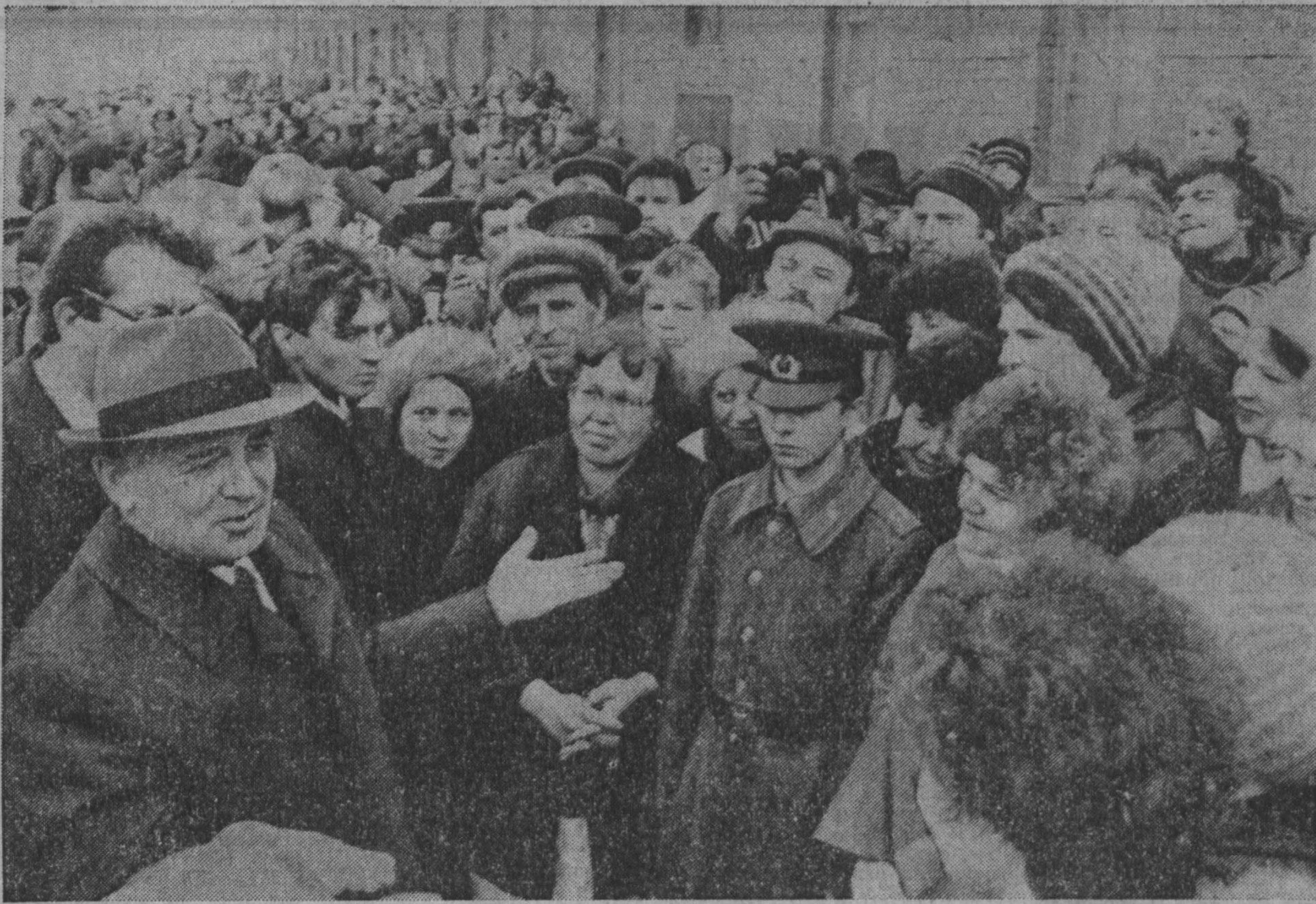
Во время встречи с жителями города-спутника Кайеркана.

Михаил Сергеевич, сказал пожилой рабочий, и не хотелось бы говорить о мелочах — неудобно, но, и социальную, приходится. Вот уже шесть лет, как насыпали вокруг дома шлак со стужками металла, так все и осталось — обугли режет, детей страшно на двор выпустить. М. С. Горбачев: Знаете, что я вам скажу, слабо вы пользуетесь сейчас перестройкой. Надо трасти своих руководителей основательно,