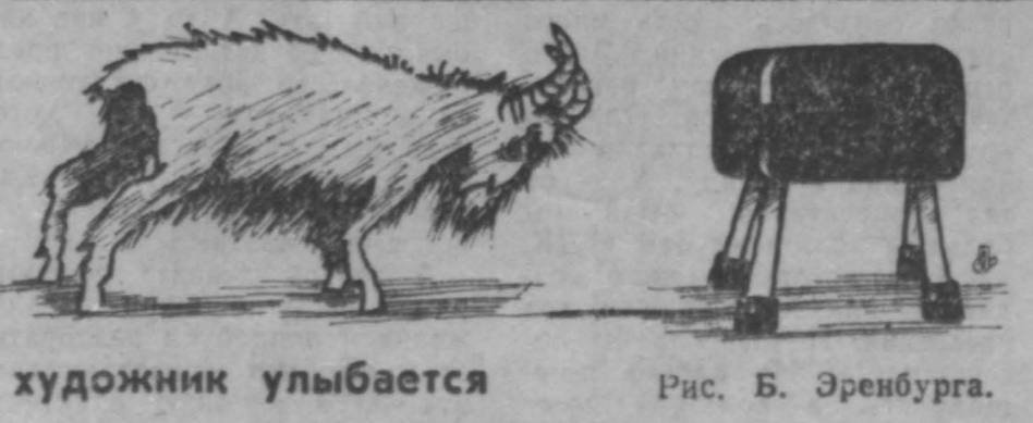
художник улыбается