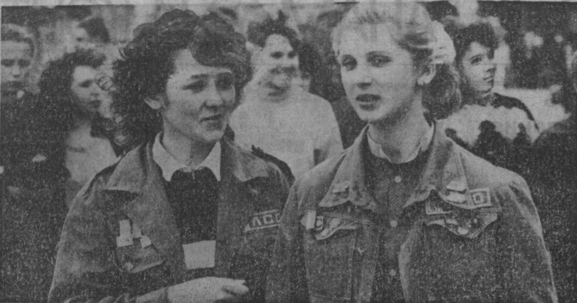
фотоконкурс «Земля Кузнецкая»