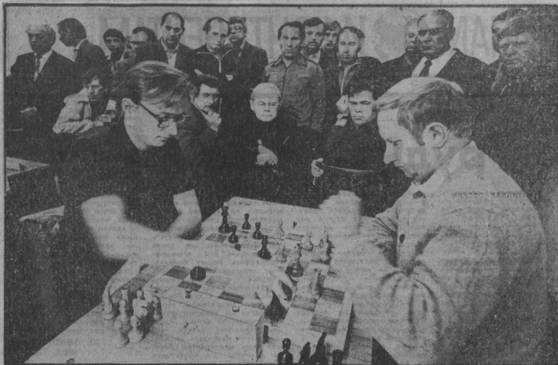
на приз газеты «Кузбасс»