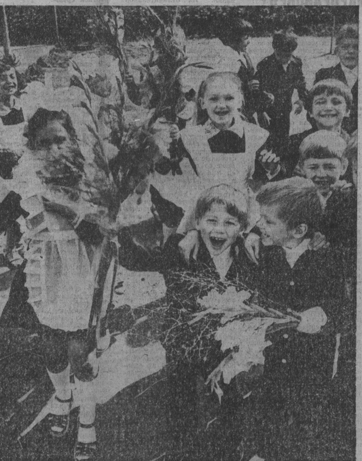
сегодня - День знаний

К разряду трудных я бы отнес и вопросы о взаимоотношениях «со смежниками». Дорога есть дорога, и всегда чужая работа локомотивных бригад дает желанный результат — случаются накладывы и диспетчерской службой, в путином хозяйстве. Наш же основной показатель — перевозки, то есть тонно-километры. Любая срыв бьет по нашей экономике.