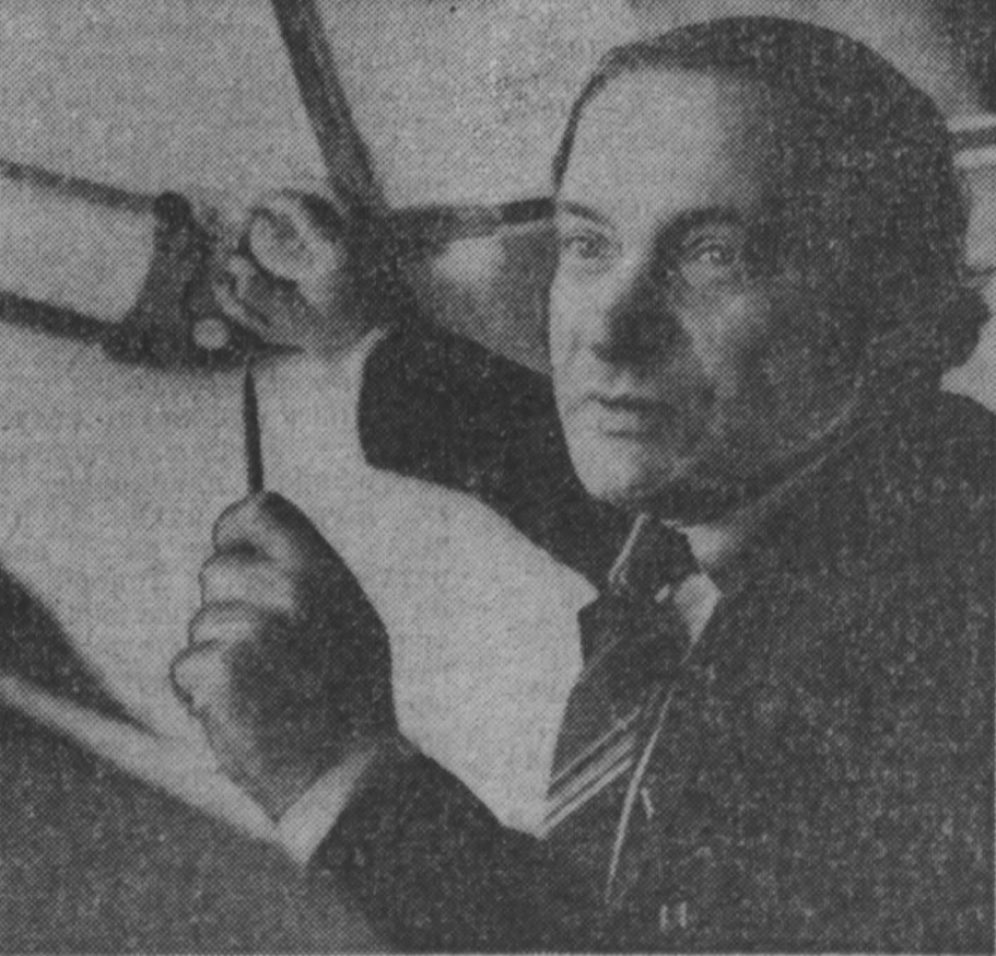
Конструктор первой категории конструкторского бюро механизации и автоматизации завода шахтной автоматики. Это призвание и профессия одновершено.