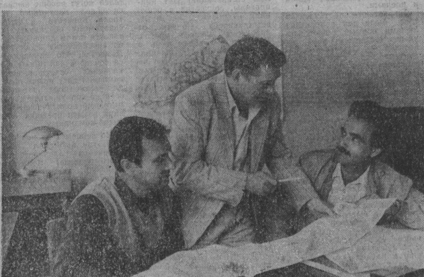
Валерий Владимирович Поляков родился 27 апреля 1942 года в Туле. В 1965 году он окончил 1-й Московский ордена Ленина медицинский институт имени И. М. Сеченова. Затем работал в различных научных и исследовательских институтах и организациях. Зарекомендовал себя способным и эрудированным специалистом в области космической медицины. Неоднократно принимал участие в медицинском обеспечении пилотируемых полетов на космических кораблях «Союз» и орбитальных станциях «Салют». Он кандидат медицинских наук.

Космонавт-исследователь корабля «Союз ТМ-6» Владимир ЛЯХОВ.