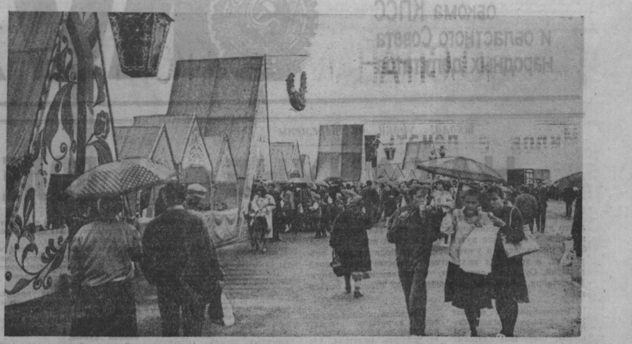
Тысячи кемеровчан побывали в минувшие выходные дни на традиционных ярмарках, организованных в честь Дня шахтера. Расписные терема, яркие вывески, веселые ирокейские встречи, ли посетители. Здесь можно было не только сделать покупки, но и посмотреть демонстрацию новых моделей одежды.