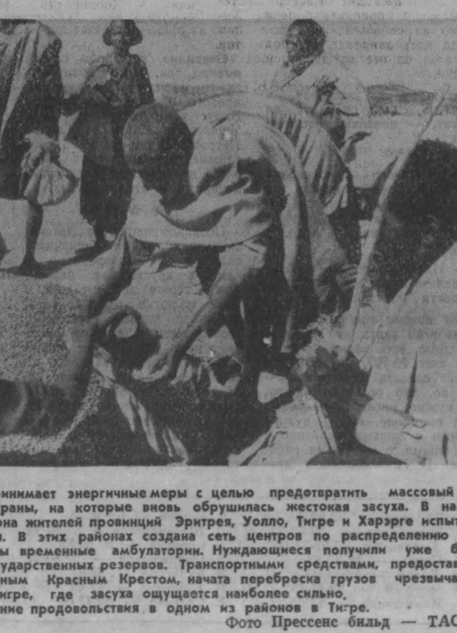
Правительство Эфиопии принимает энергичные меры с целью предотвратить массовый голод в северных районах страны, на которые вновь обрушилась жестокая засуха. В настоящее время около 3,2 миллиона жителей провинций Эритрея, Уолло, Тигре и Харэрге испытывают нехватку продовольствия. В этих районах созданы семь центров по распределению продуктов питания, организованы временные амбулатории. Нуждающиеся получили уже более 50 тысяч тонн зерна из государственных резервов. Транспортными средствами, предоставленными ООН и Международным Красным Крестом, начата переброска грузов чрезвычайной помощи из порта Ссб в Тигре, где засуха ощущается наиболее сильно. НА СНИМКЕ: распределение продовольствия в одном из районов в Тигре.

Жители могут обменять у них старые газеты на туалетную бумагу. Эти и другие мероприятия позволяют японцам перерабатывать около половины отходов. Две трети не поддающихся переработке отходов сжигают. Крупные предметы, как правило, идут под пресс. Однако в Мачиде, населенном пункте западнее Токио, артель инвалидов занимается пошивкой выброшенных изделий. И тем не менее, несмотря на имеющиеся достижения, в этой области у японцев есть немало проблем. Усиливается сопротивление созданию на сыпных островах и берегах