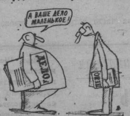
Рис. М. Ларичева.