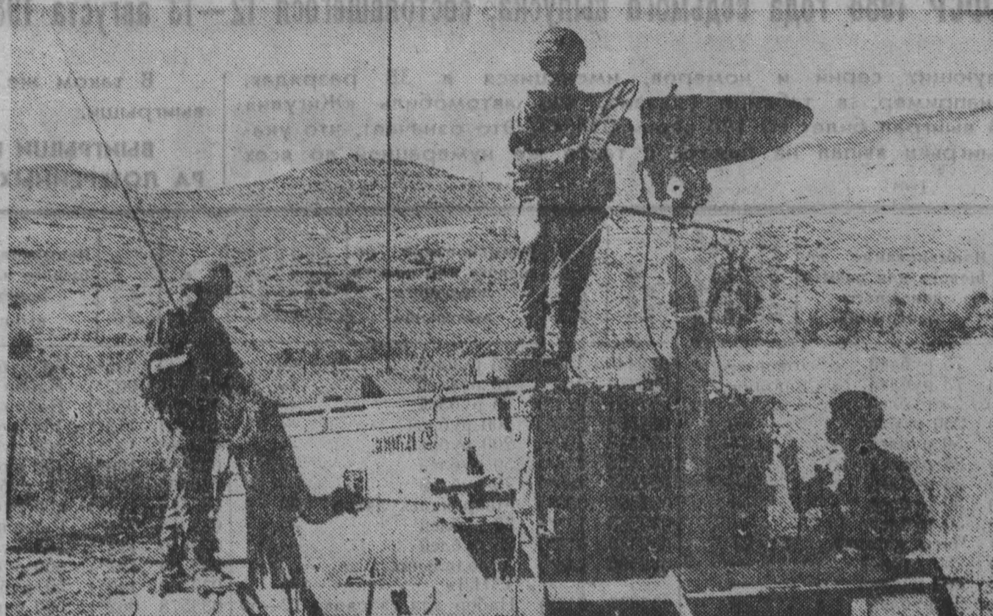
В восточном Средиземноморье проводятся первые совместные военно-морские маневры США и Израиля.