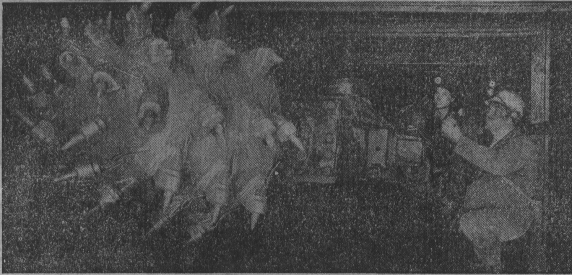
навстречу Дню шахтера

Могли бы мы даже в нынешних условиях давно выполнить план заготовки сена, но не хватало рудных подборошков, транспорта, стояла травяная сушка без сушарки. В прошлом году нам удалось получить отличное михайловское сено. Это случилось на удоях. Ныне мы сосредоточили внимание на его заготовке. Но в типовую тележку входит, даже с наросшими бортами, от 700 до 1200 килограммов травы. Переоборудовать тележки — значит посадить наших механизаторов в непогожие дни на тариф. А совхозу нужны травы и строительные материалы. Надо бы промышленности подумать хорошо над обеспечением се-