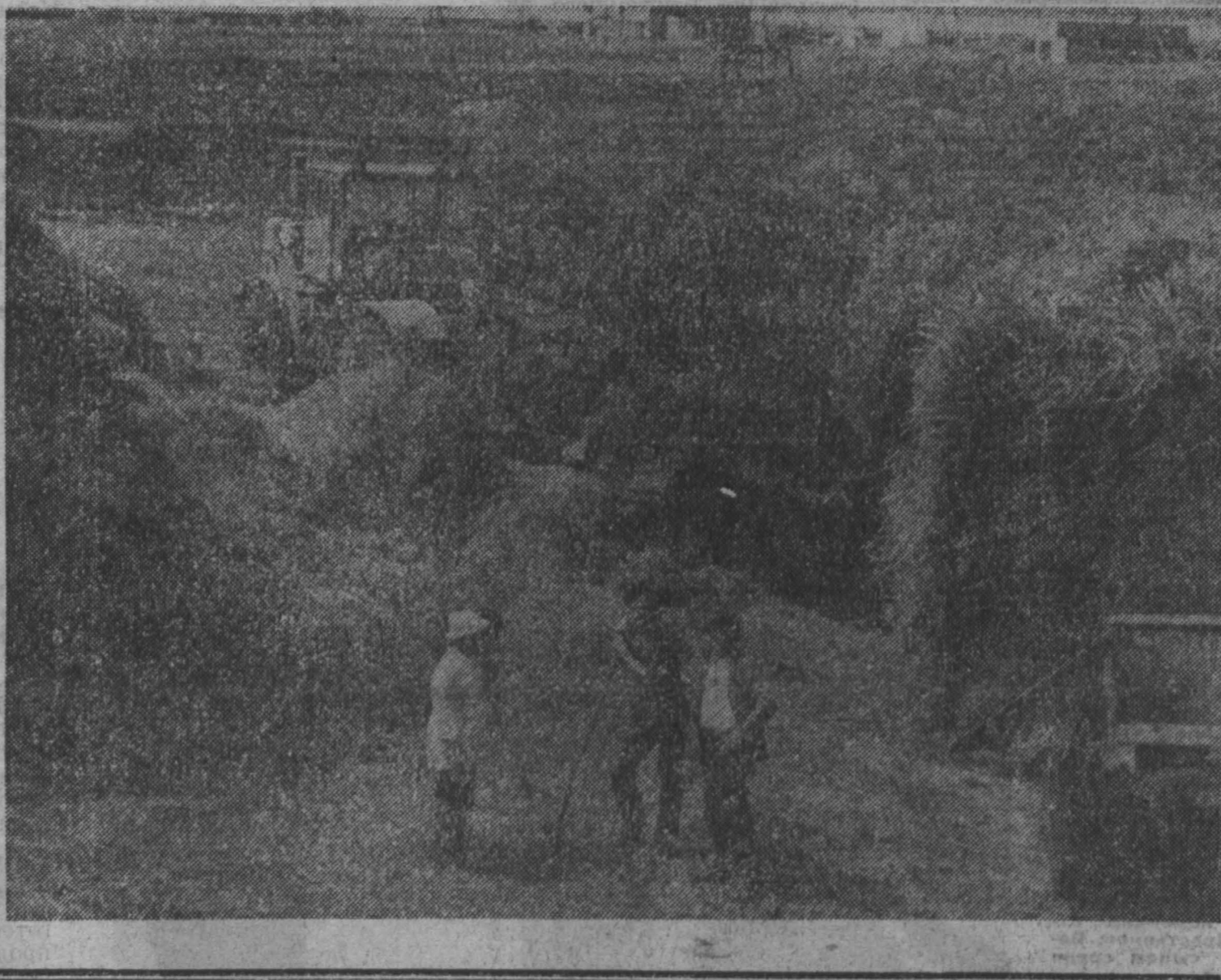
на актуальную тему