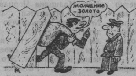
Рис. А. Климана.

Насмотрелся передач о гипнозе Рис. А. Алещичева.