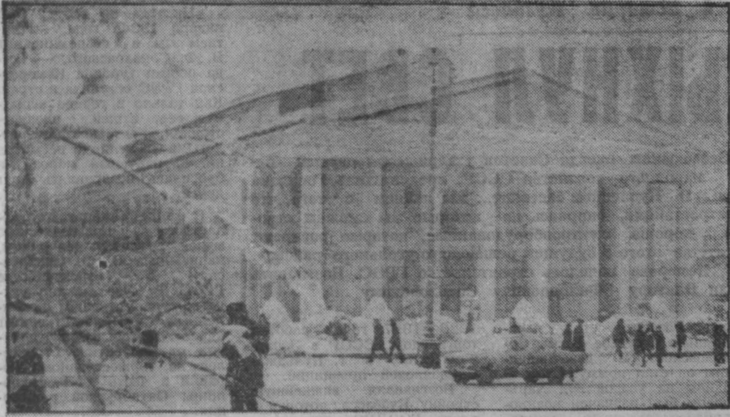
фотоконкурс «Земля Кузнецкая»