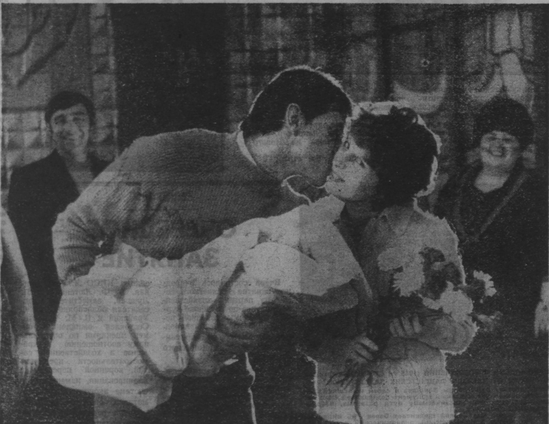
фотоконкурс «Земля Кузнецкая»