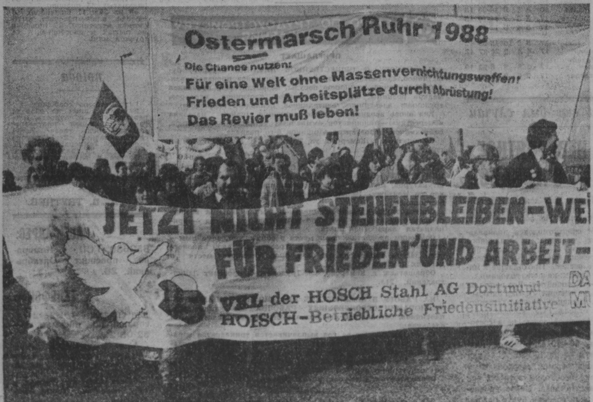
В ФРГ в этом году в тридцатый раз прошли традиционные марши мира. Отличительной особенностью главного из них — марша через индустриальный Рур стало то, что его маршрут начался от ворот одного из предприятий концерна «Крупп» в Дуйсбурге, которому в ближайшее время угрожает закрытие. НА СНИМКЕ: идет головная колонна участников манифестации.