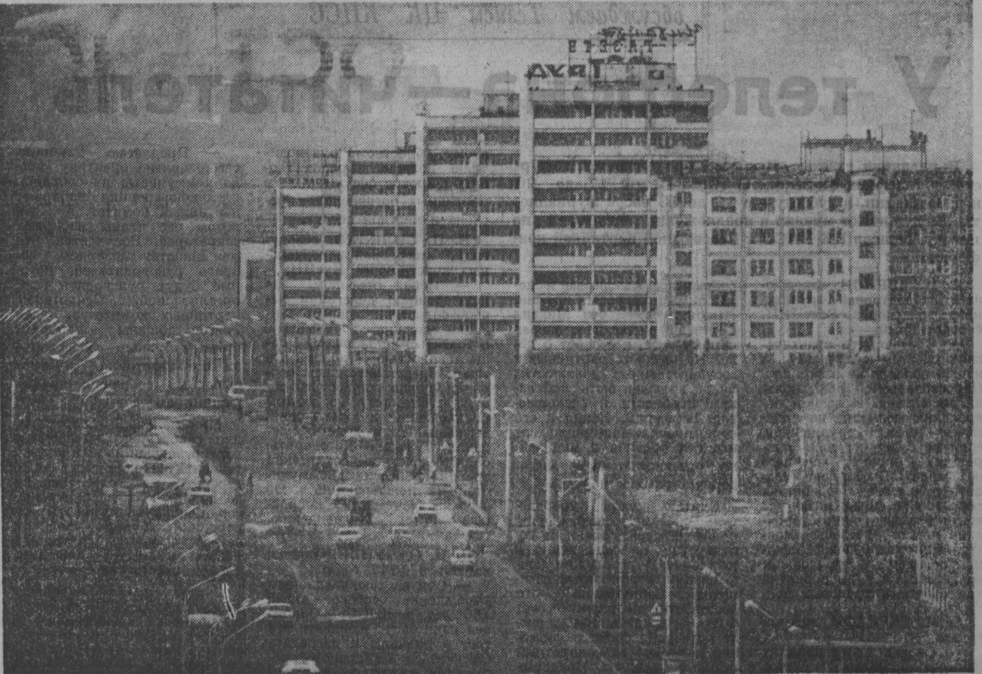
Город Кемерово. Пускай и в будущем твой облик люди узнают по силуэтам заводских корпусов, но воздух над крышами домов пусть будет чистым и небосвод — голубым...

Единственно возможный путь — ускорение научно-технического прогресса, освоение новых видов продукции, введение экономических стимулов, возмодно будет в короткий срок повысить объем производства в полтора-два раза без увеличения численности работающих. Стратегически важными становятся такие направления, как наноинженерия, освоение катализаторов новых поколений, развитие наукоемкой химии и т. д. Сегодня, однако, научно-исследовательские работы отстают. Химики-производители привыкли работать на импортном оборудовании. Между тем валюты на его покупку нет, она сегодня зарабатывается преимущественно