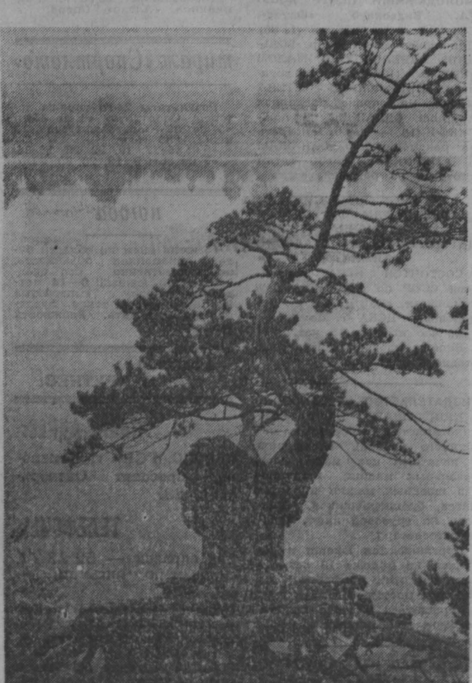
Природа нередко выживает и в труднейших условиях, но ей очень нужна помощь человека...

Итак, что касается социальной сферы, нужна существенная доработка схемы.