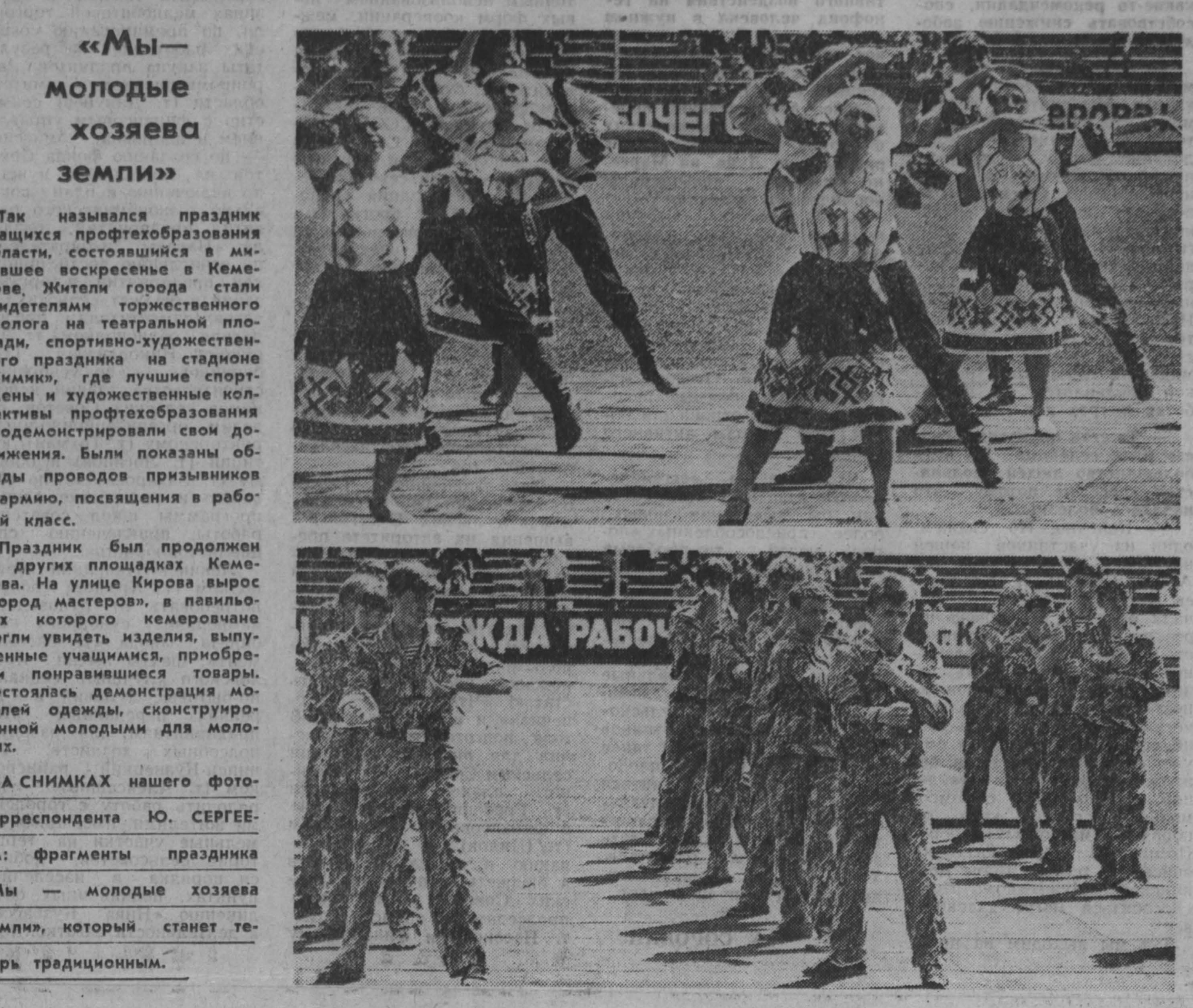
«Мы — молодые хозяева земли», который станет традиционным.