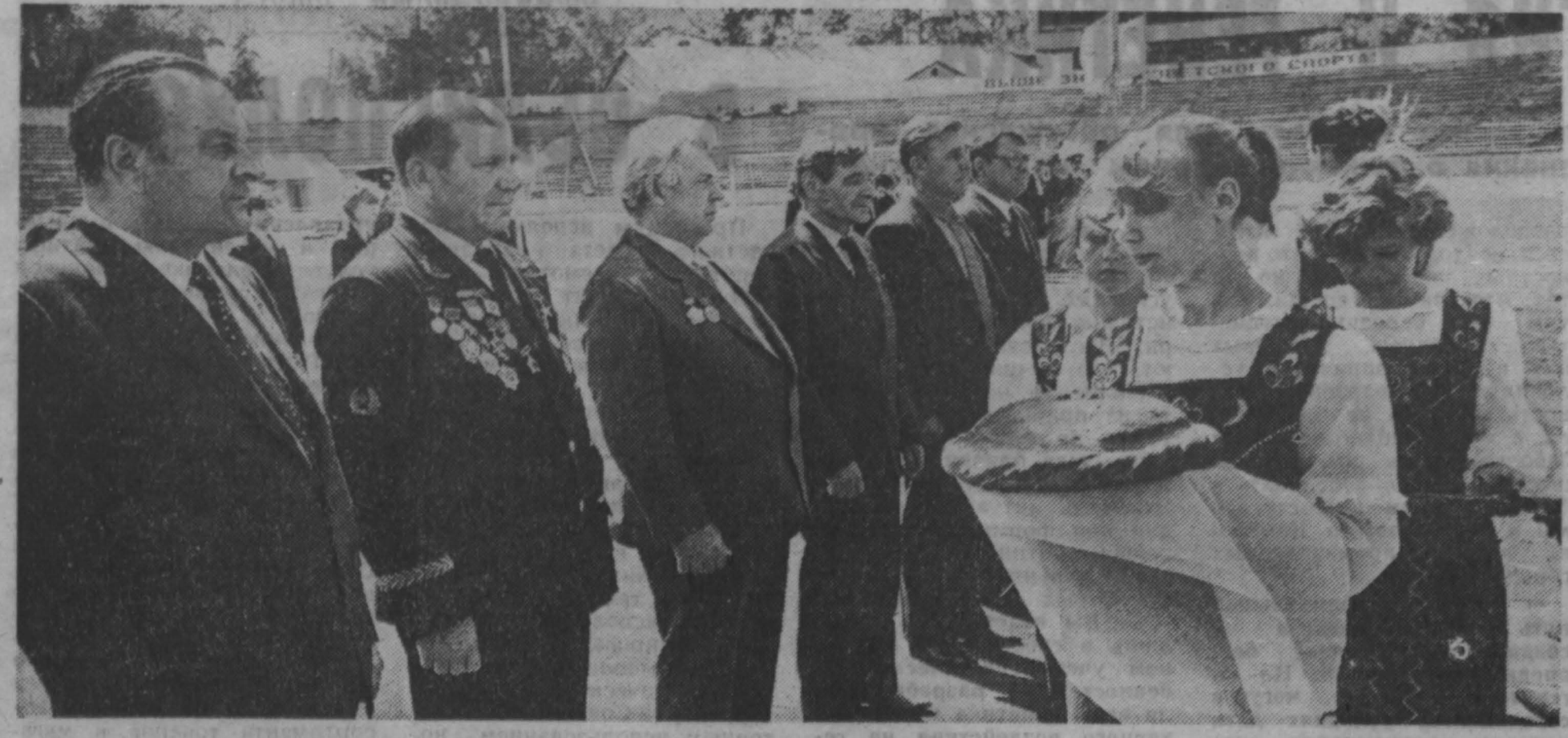
«Мы — молодые хозяева земли»

В финале женского турнира обыграл с крупным счетом — всех соперниц чемпионки области стали шахматистки КузПИ. А. ПОНОМАРЕВ, г. Кемерово.