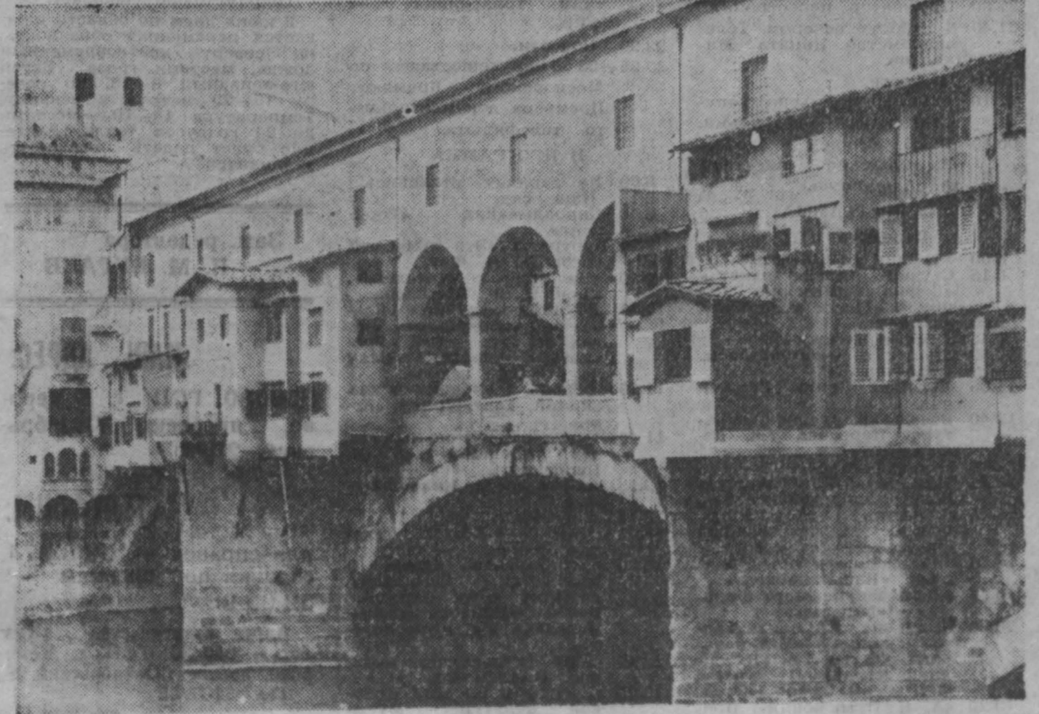
ФЛОРЕНЦИЯ, город в Центральной Италии. Один из главных экономических центров страны. Основан в I веке до н. э. римлянами на месте поселения этрусков. Здесь находятся уникальные художественные памятники средних веков и эпохи Возрождения; собор Свята-Мария дель Фьоре [XIII в.], палаццо Сильорья [XIII—XV вв.], церкви XIII—XVIII веков, улицы XV—XVI веков. НА СНИМКЕ: Флоренция. Мост через реку Арно.

Вашингтон. После того, как в США в законодательном порядке был введен запрет на курение в самолетах, совершающих непродолжительные рейсы, против этого постановления дружно выступили табачные магнаты и заядлые курильщики. Современное невинное обществом стало, механики, занимающиеся налетным обслуживанием самолетов.