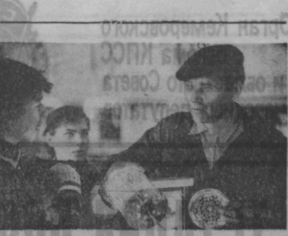
ПАРТНЕРАМИ стали ученики школы № 10 областного центра и трест «Кемеровогражданстрой».