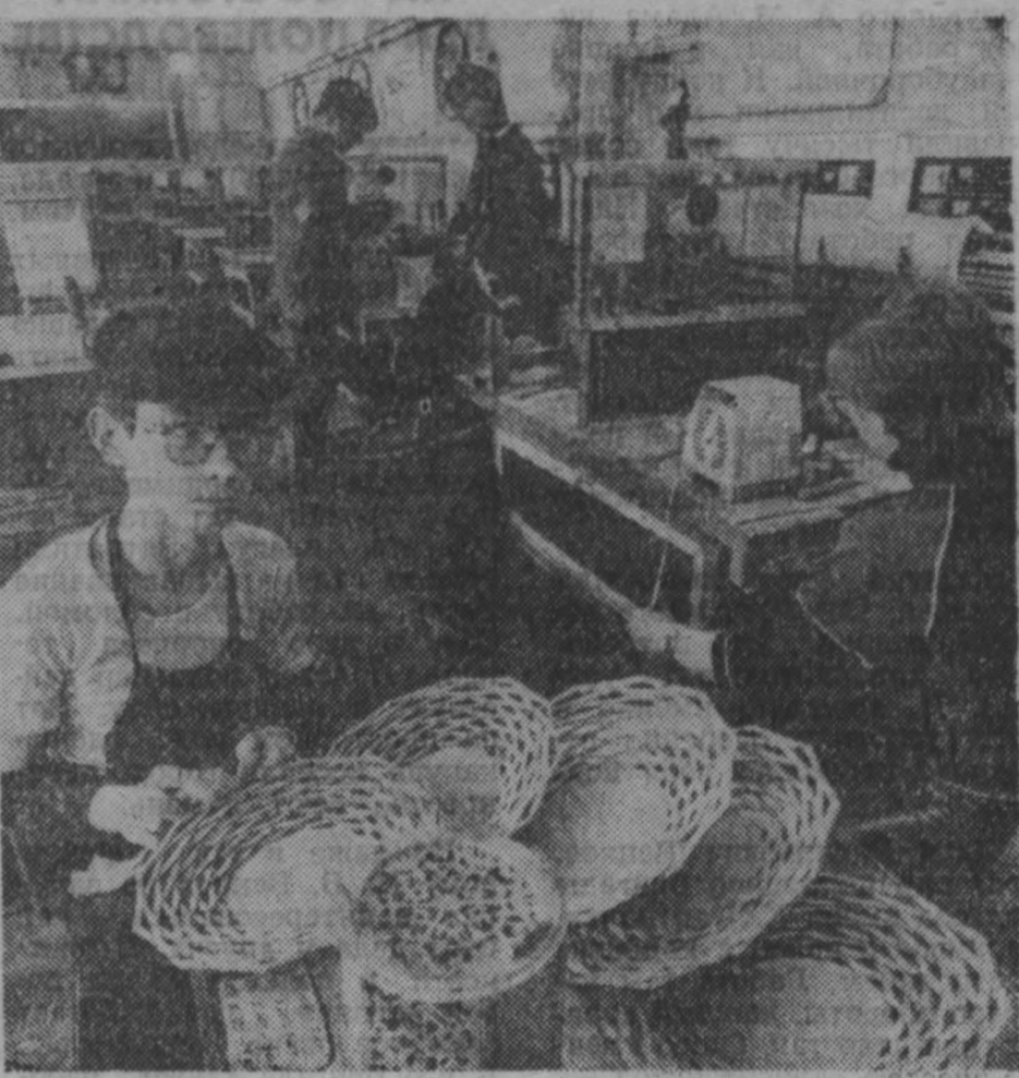
читатель продолжает разговор