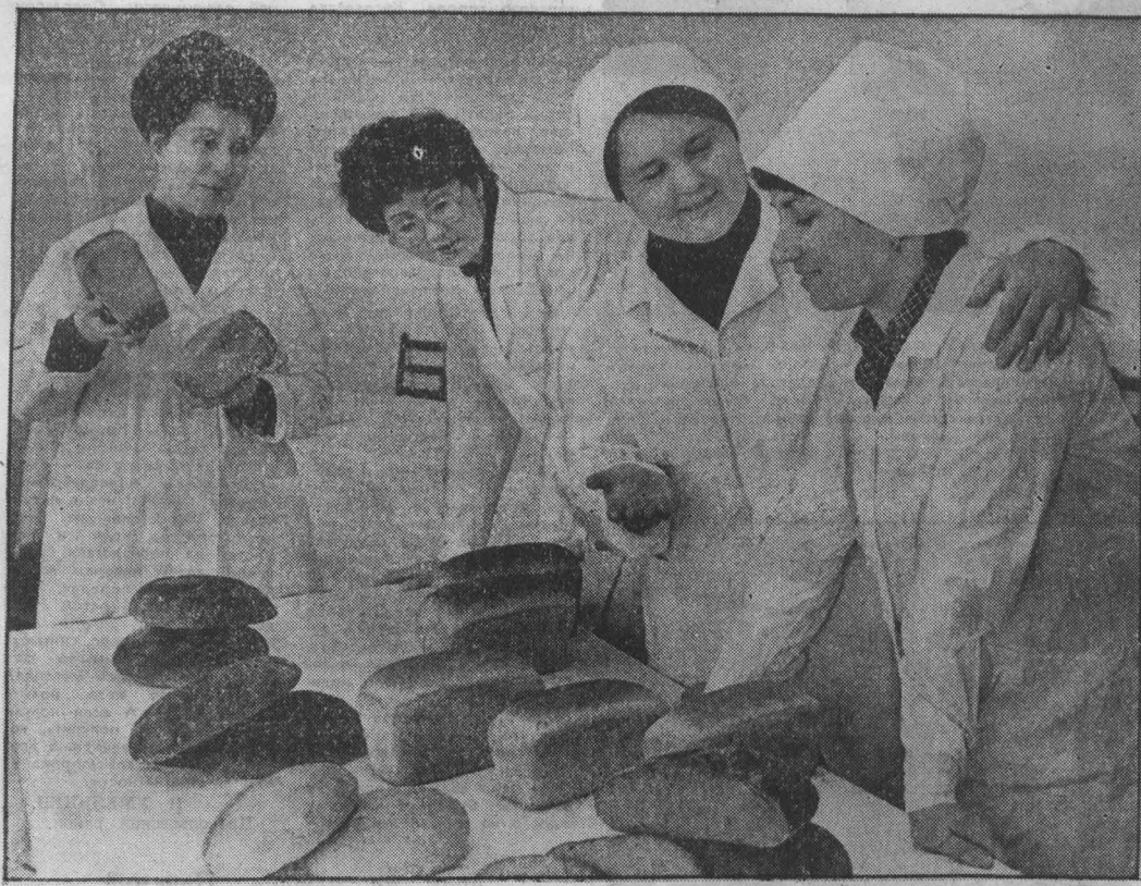
человек и время