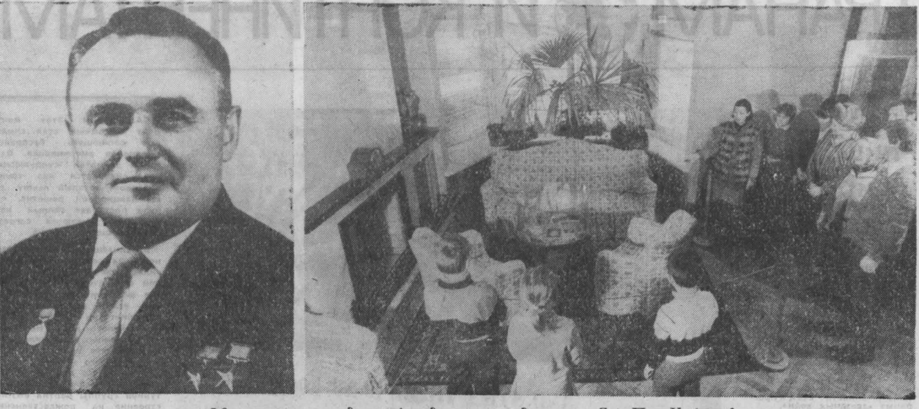
к 80-летию со дня рождения академика С. П. Королева

Художник улыбается. Рис. М. Ларичева и Б. Эренбурга.