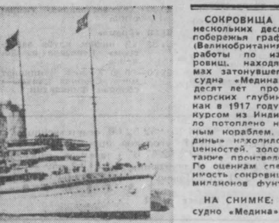
НА СНИМКЕ: так выглядело судно «Медина» в 1911 году.