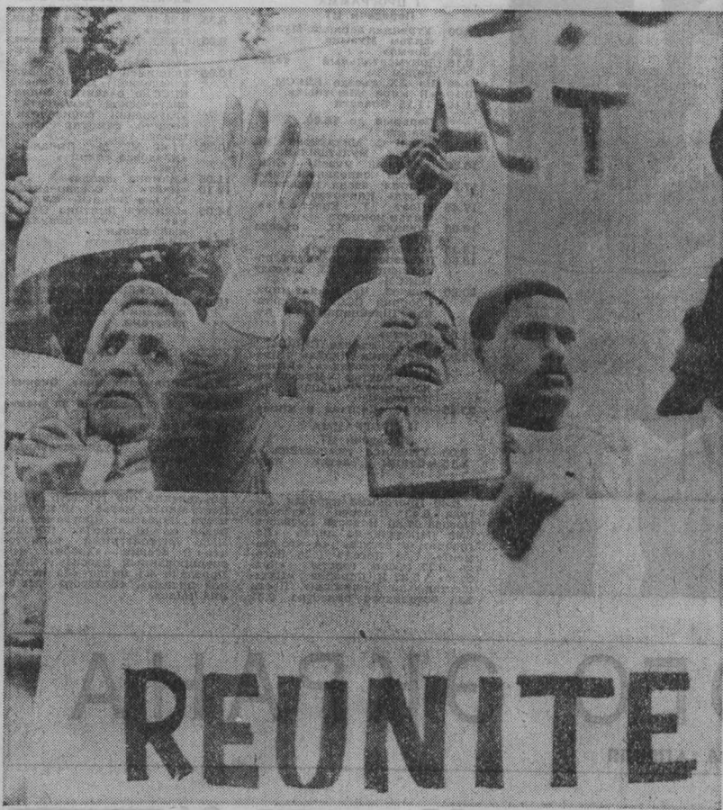
Воссоединения палестинских семей, разлученных в результате дискриминационной политики израильских оккупантов...