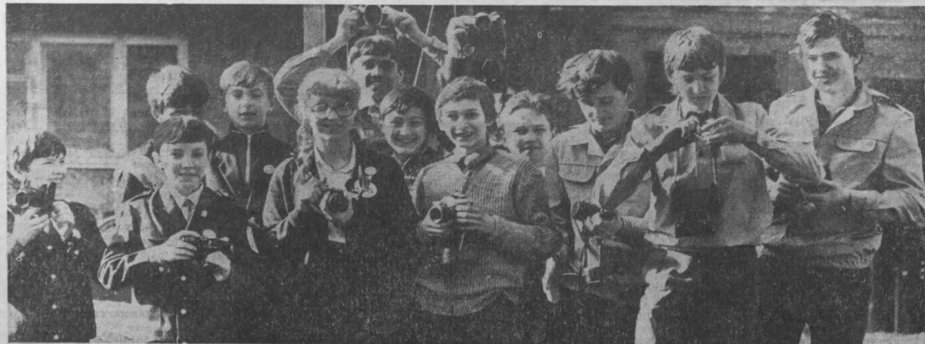
второй Всесоюзный фестиваль народного творчества