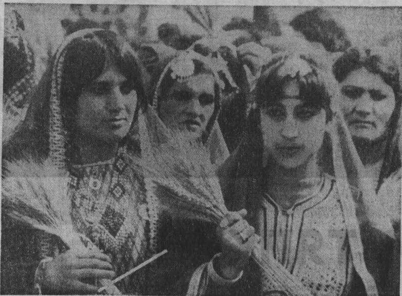
НАБУЛ. Под девизом национального примирения Демократическая Республика Афганистан отметила День крестьянина...