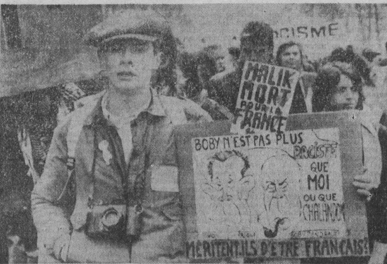
ПАРИЖ. Десятки тысяч парижан, антифашистских и общественных организаций, прибывшие сюда из многих районов Франции, приняли участие в состоявшейся во французской столице манифестации протеста против проекта нового кодекса о гражданстве. Этот документ, разработанный правительством правого большинства, призван устоять действующие сейчас положения за-

Х. Ф.: — Прежде всего нацеленность на изменения. Кроме того, как мне кажется, она отличает реальные взгляды на будущее человечества. Эти принципы должны стать предметом заботы Соединенных Штатов. Поскольку я считаю себя другом США, не могу не сказать, что их нынешние планы, особенно связанные с СОВ, представляются мне катастрофой.