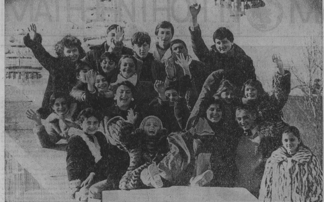
XVI Всесоюзная неделя музыки для детей и юношества