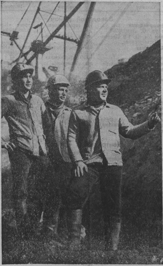
Угольный разрез «Сибирский» объединения «Кемеровоуголь» по итогам работы за истекший год вышел победителем в социалистическом соревновании среди предприятий Минуглепрома СССР и награжден переходящим Красным знаменем ЦК КПСС, Совета Министров СССР, ВЦСПС и ЦК ВЛКСМ с занесением на доску Почета ВДНХ СССР. Ритмично и напряженно трудится коллектив разреза и в нынешнем году. В ответ на Обращение ЦК КПСС к советскому народу многие коллективы разреза, откликнувшись на призывы ЦК КПСС, начали работу по выполнению плана на 1987 год. В разрезе «Сибирский» объединения «Кемеровоуголь» по итогам работы за истекший год вышел победителем в социалистическом соревновании среди предприятий Минуглепрома СССР и награжден переходящим Красным знаменем ЦК КПСС, Совета Министров СССР, ВЦСПС и ЦК ВЛКСМ с занесением на доску Почета ВДНХ СССР. Ритмично и напряженно трудится коллектив разреза и в нынешнем году. В ответ на Обращение ЦК КПСС к советскому народу многие коллективы разреза, откликнувшись на призывы ЦК КПСС, начали работу по выполнению плана на 1987 год.