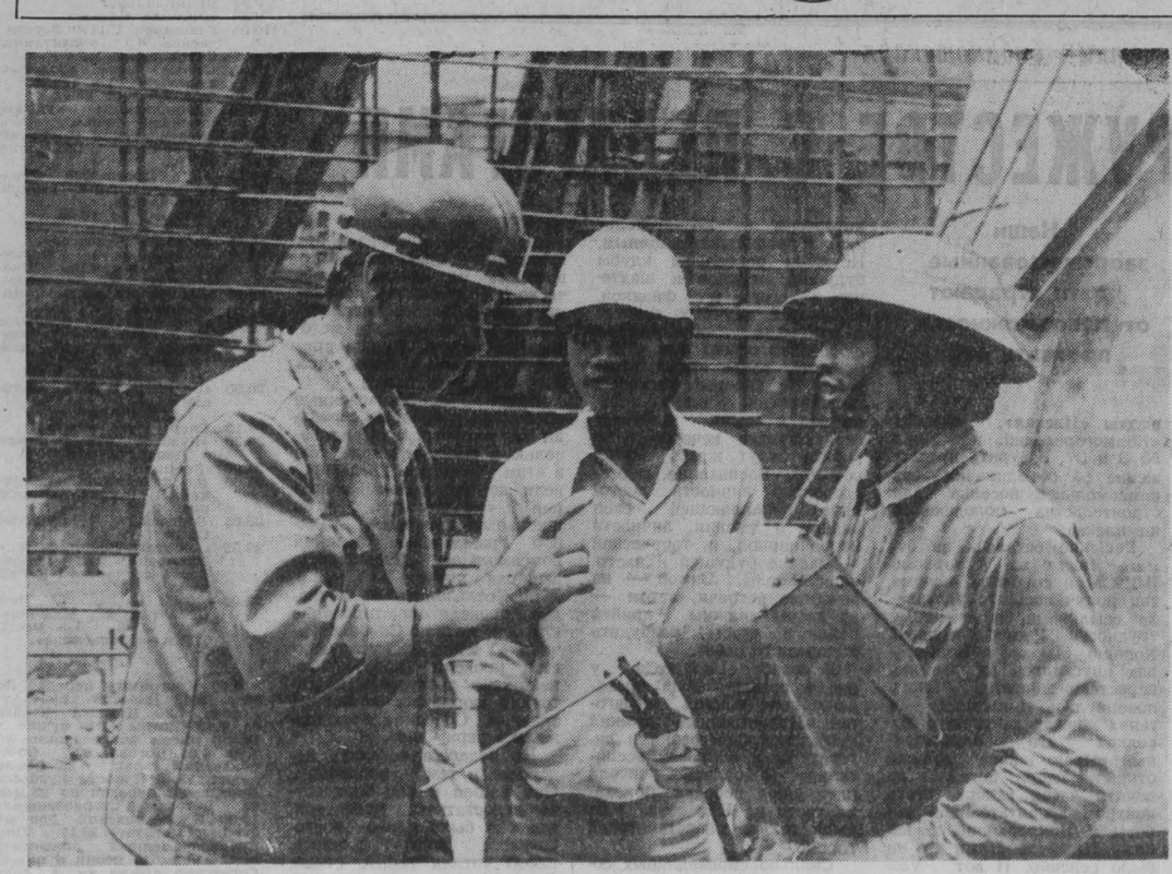
СГБ Советский Союз оказывает Вьетнаму помощь в строительстве целого ряда мощных энергетических объектов, важнейшим из которых является гидроэнергетический комплекс Хоабинь на реке Черной мощностью два миллиона киловатт и ТЭС Фадай мощностью 640 тысяч киловатт.