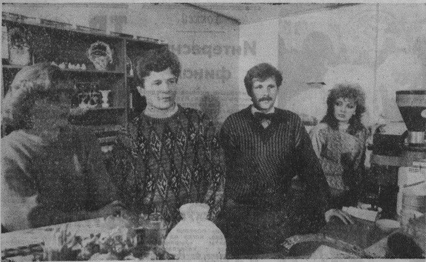
Салон отдыха — по договору