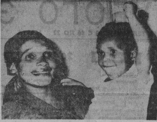
ЮАР. Этот снимок, на котором изображены счастливые мать с сыном, не из семейного альбома. После восьмимесячного пребывания в тюрьме им удалось вырваться на свободу, или, лучше сказать, домой, так как понятие свободы в государстве апартеида может иметь смысл применительно лишь к белым его гражданам...