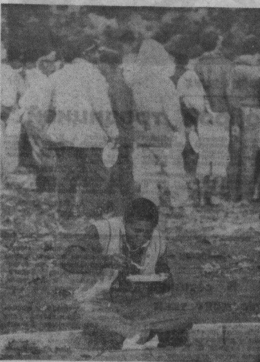
В АШИНГТОН. Каждый год армия несчастных пополняется все новыми нищими и голодными. Сейчас в стране 20 млн. американцев вынуждены искать кусок хлеба по урнам и помойкам...