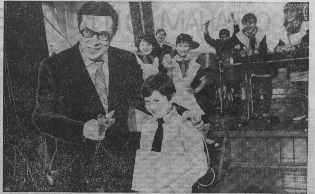
второй Всесоюзный фестиваль народного творчества