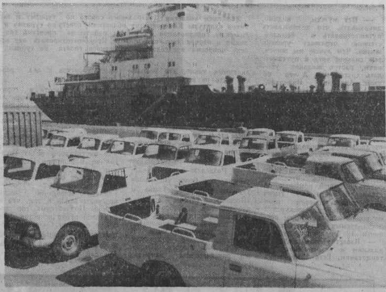
ПОРТ Коринто—главные морские ворота Никарагуа. К его глубоководным причалам шварцуют сотни судов из различных стран мира, в том числе и из СССР. Советский Союз оказывает молодой республике братскую помощь, поставляет в Никарагуа технику, необходимую народному хозяйству страны. НА СНИМКЕ: очередная партия советских автомобилей прибыла в Никарагуа. (ТАСС).

ДАМАСК, 9. (ТАСС). Напряженной остается обстановка на Голанских высотах, захваченных Израилем у Сирии. По поступившим сюда сообщениям, в административном центре этого района Маджаль-Шамсе и других населенных пунктах не прекращаются столкновения между сирийскими жителями и подразделениями израильской армии. Оккупанты объявили Голанские высоты «закрытой военной зоной», закрыли школы, магазины, медицинские пункты. Возмущенные жители вышли на улицы и потребовали ликвидации военно-оккупационного режима, возвращения Голан Сирийской Арабской Республике.