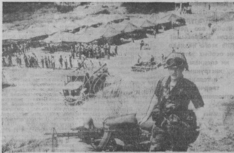
13 марта исполняется восьмилетие годовщины Народно-демократической революции в Гренаде. Однако народ небольшого государства в Карибском бассейне отмечает эту дату в условиях фактической оккупации страны Соединенными Штатами.

Удаи Фудзисима. Искусственно раздувая ее, отмечает он, американцы прельщаются сближением между двумя странами и втягивают своего дальневосточного союзника в усложняющуюся гонимую войну.