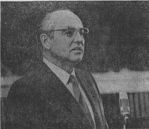
Выступление М. С. Горбачева на XX съезде комсомола Эстонии. В зале XX съезда комсомола Эстонии.