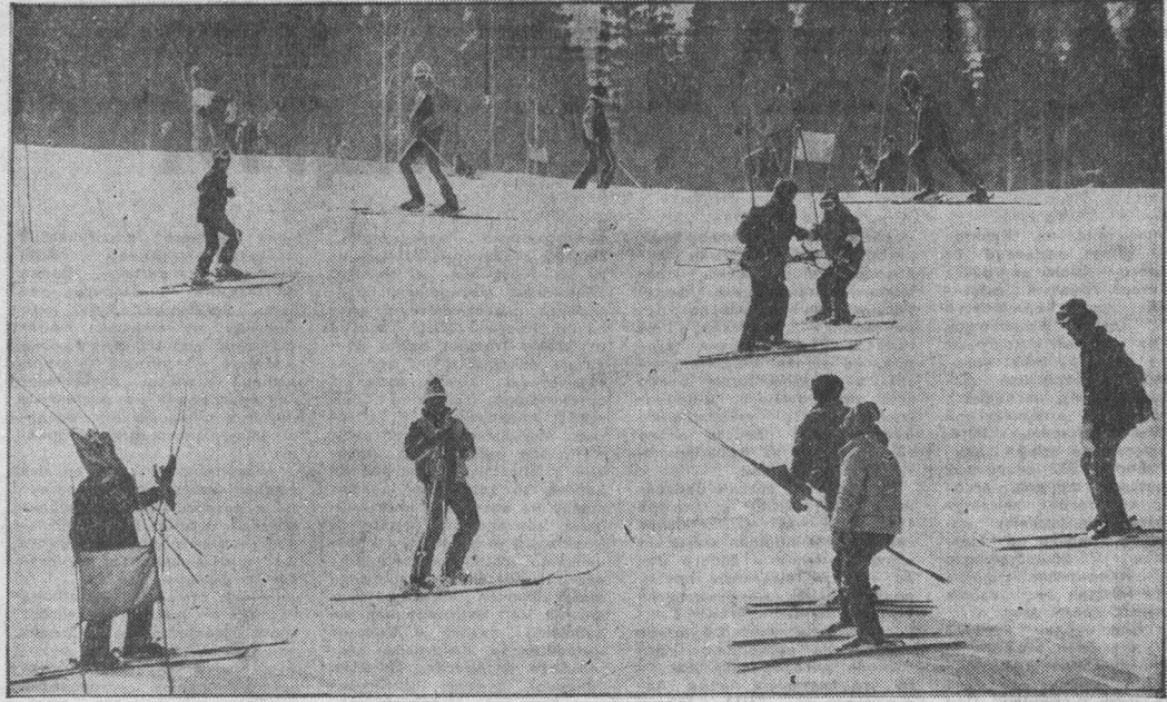
Лыжники на горе Югус.