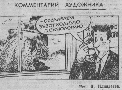
Рис. В. Илидзева.

Выпуск особо модных изделий выполнен всего на 70,4 процента. Нередко эти изделия изготавливаются с большими отступлениями от эталона, имеют грубые дефекты и низкие потребительские свойства.