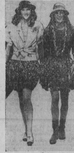
«Мини» возвращается. Во всяком случае таной вывод можно сделать, посмотрев эти модели (на снимке), предельно итальянскими моделями в коллекции одежды сезона весна-лето 1988 года.

Молодые хотят жить лучше, чем люди старшего поколения, и это вполне естественно.