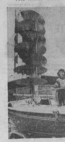
Принципиально новую конструкцию для улавливания и использования движущей силы ветра применили создатели «парусной лодки», которая демонстрируется сейчас на выставке оригинальных идей и изобретений в Нюрберге.