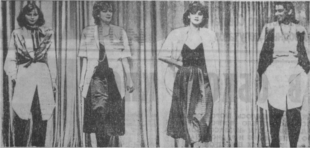
проблемы службы быта