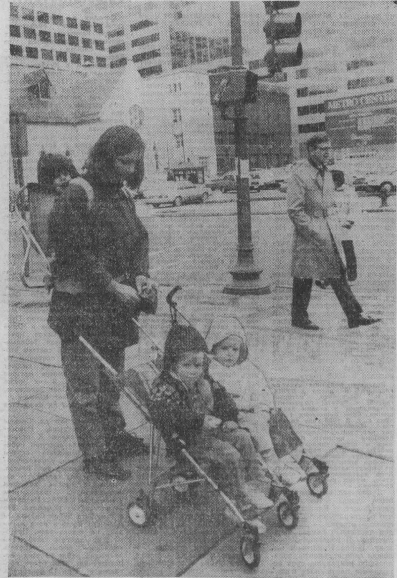
ВАШИНГТОН. На улице города.