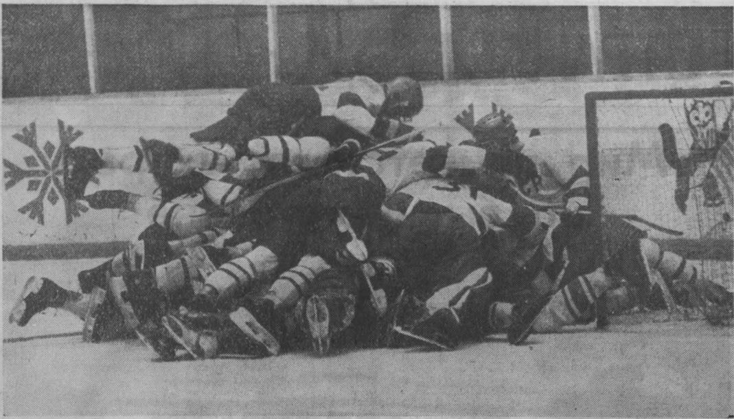
фотоконкурс «Земля Кузнецкая»