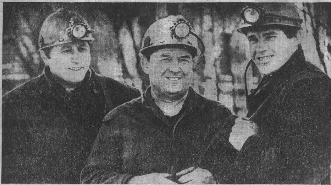
Более двух тысяч метров горных выработок сверх плана произведено в начале года подготовительными коллективами шахтоуправления «Физкультуринок» объединения «Севернузбассуголь». Отлично трудятся здесь проходческая бригада с участка № 14, ко-