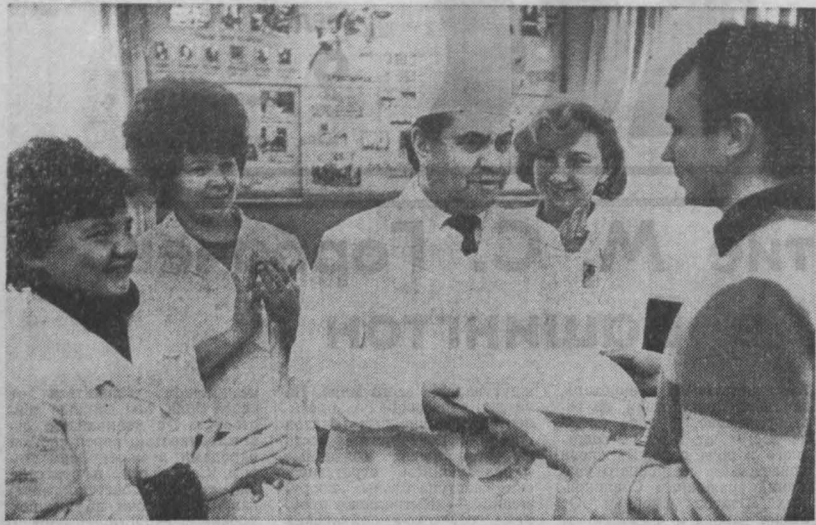
люди для людей