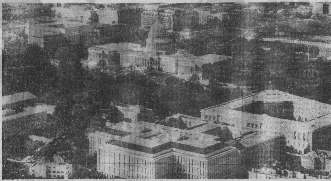
ВАШИНГТОН — столица Соединенных Штатов Америки. Общий вид города. В центре Капитолий — здание конгресса США.