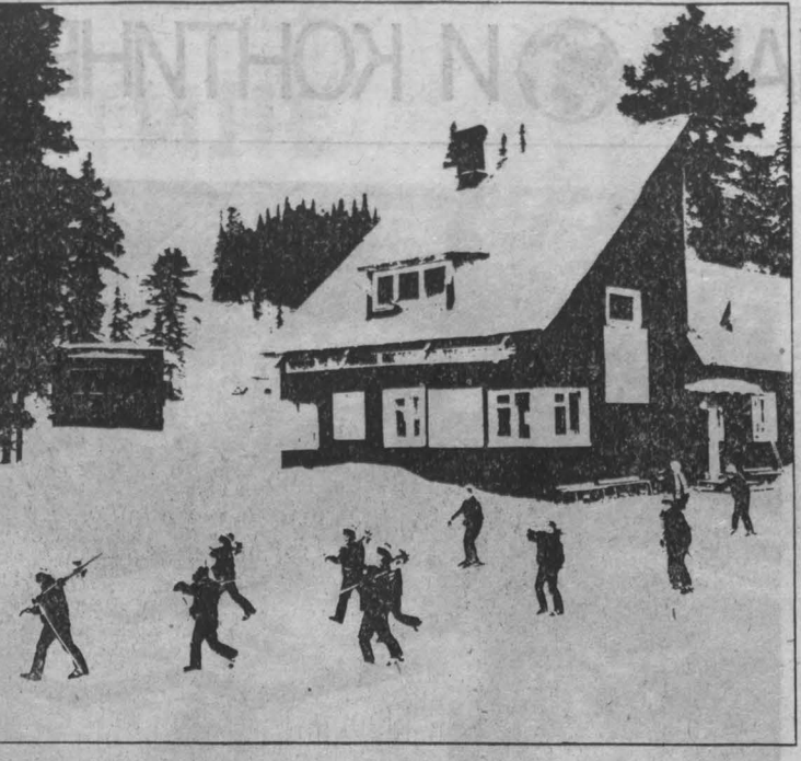
В КУЗБАССЕ открылся один из четырех горнолыжных центров олимпийской подготовки, имеющих в нашей стране.

Мы неуклонно идем к разумным видам экономической деятельности. Сказывается это и в сфере досуга. В. СИНЯВСКИЙ, спец. корр. «Кузбасса», г. Новокузнецк.