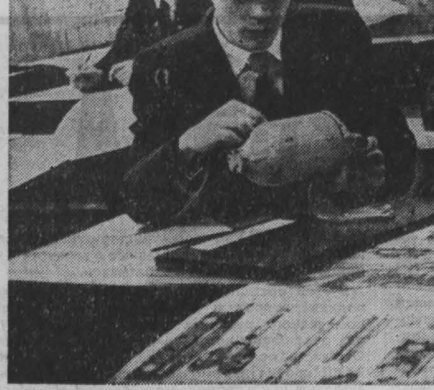
ги, мастера производственного обучения готовят будущих горняков, проточников, машинистов тепловоза. Многие кабинеты училища