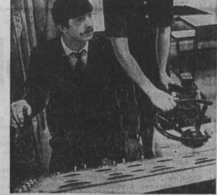
В Новокузнецком СПТУ-49 учащаяся работа, которая предстоит работать на Западно-Сибирском металлургическом комбинате. Опытные педаго-