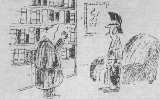
— Я говорю по английскому и немецкому, выучил японский, арабский, итальянский, могу объясниться на французском и венгерском, а языка, на котором изъясняется мой сын, осилить не в состоянии.