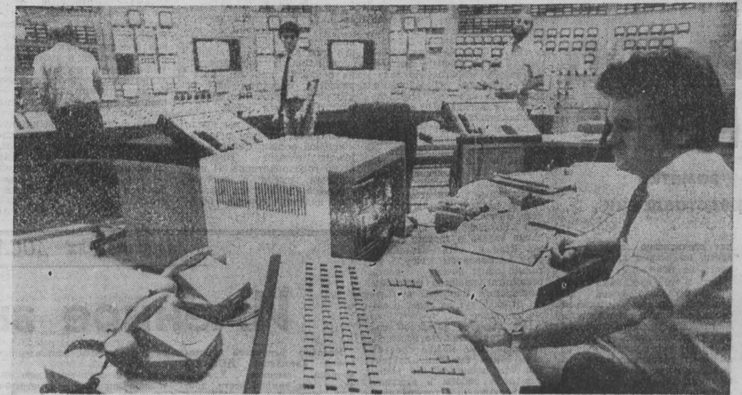
ВЕНГРИЯ. В канун 70-летия Великого Октября досрочно сдан четырехэтажный атомный АЭС, являющийся важным элементом для народного хозяйства республики. Уже в нынешнем году, сообщает агентство ИТА, станция будет выработано 10 миллиардов киловатт-часов электроэнергии. Строительство этого крупного объекта атомной энергетики осуществляется в рамках советско-венгерского сотрудничества, на основе многосторонней кооперации с другими братскими странами социализма.

НЬЮ-ЙОРК. Курение — главная причина 50 проц. сердечных приступов у молодых женщин и женщин среднего возраста. Даже у тех курящих, которые ежедневно потребляют от одной до четырех сигарет, риск сердечных приступов в два с половиной раза выше, чем у некурящих. А у курящих женщин с повышенным кровяным давлением или больных диабетом такой риск увеличивается в 2,2 раза. И танки выводили пришли американские медики, завершили многолетнее исследование группы женщин в возрасте от пятидесяти до