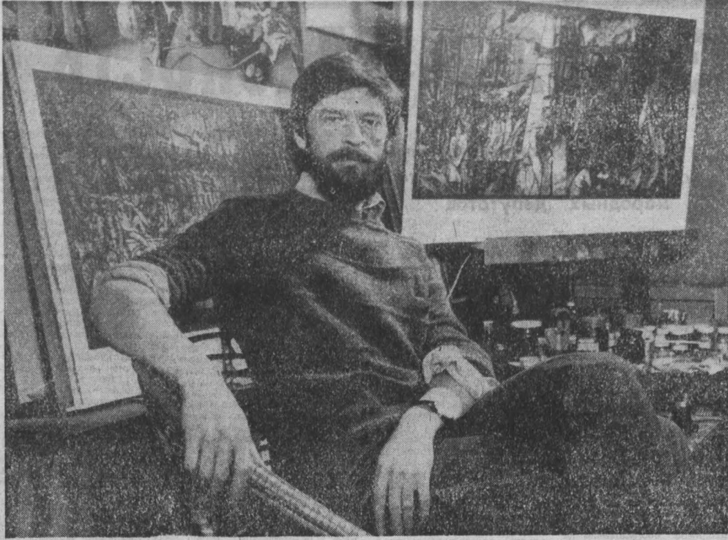
фотоконкурс «Земля Кузнецкая»

Б. СИНЯВСКИЙ, спец. корр. «Кузбасса», г. Новокузнецк.