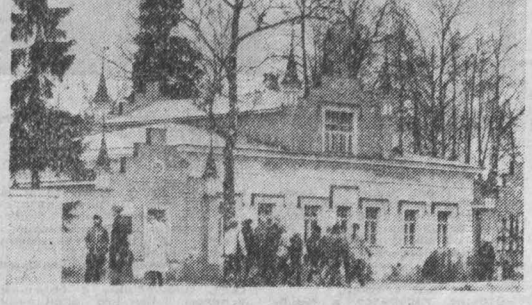
ЛЕНИНГРАДСКАЯ ОБЛАСТЬ. В Изьваре, в бывшей усадьбе семьи Рерихов, стали традиционными встречи любителей искусства...

Гражданская панихида состоится 20 ноября с 11 до 14 часов в театре оперетты Кузбасса.